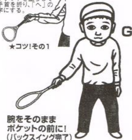
腕をそのままポケットの前に! (バックスイング完了)