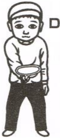
ラケットをへその前に!

コツ！の部分が大事なチェックポイントですので、ここがおろそかにならないよう、細心の注意を払います。